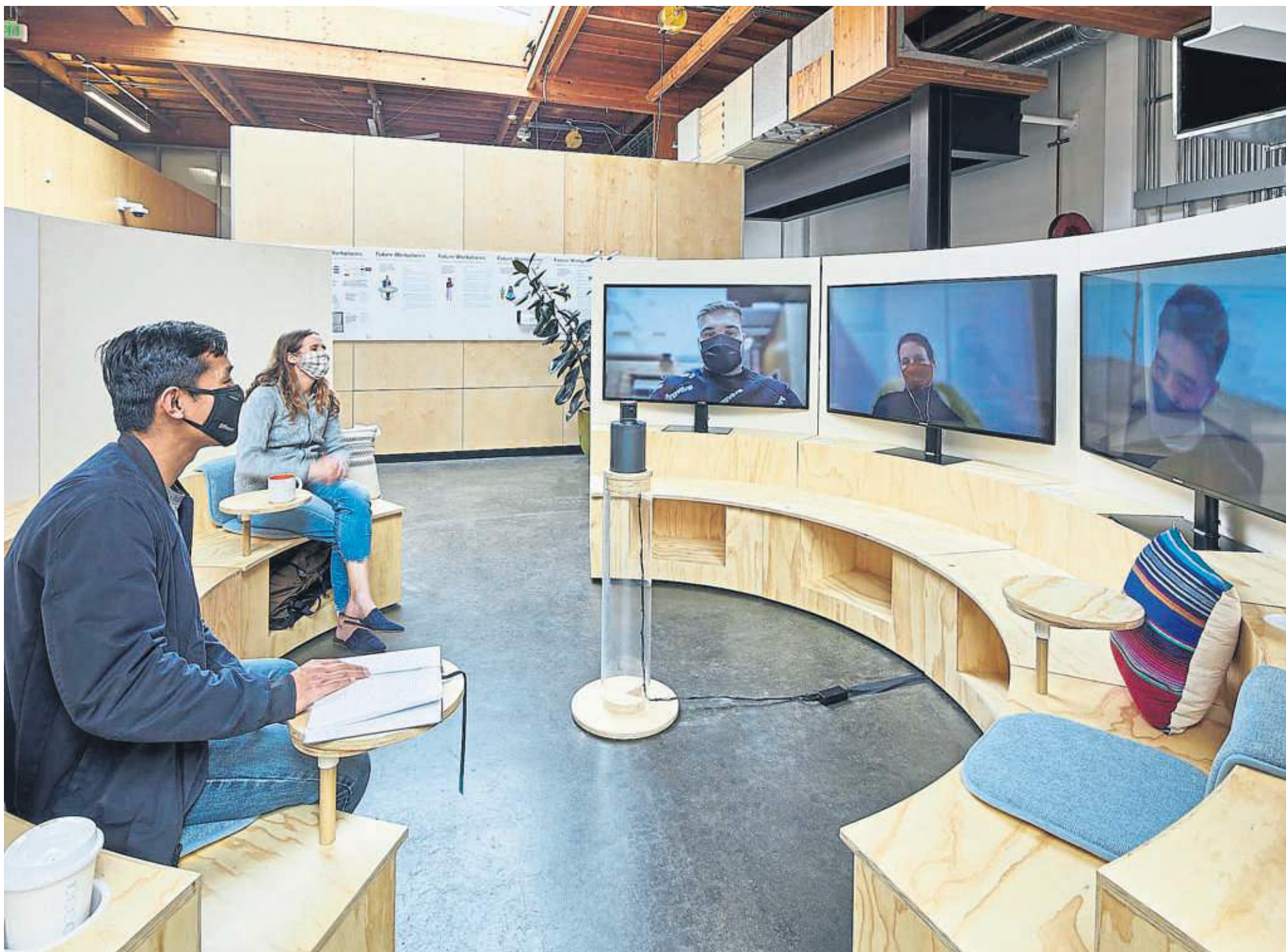
La nueva sala de reuniones de Google, Campfire, donde los asistentes en persona se sientan en un círculo con grandes pantallas con quienes teletrabajan