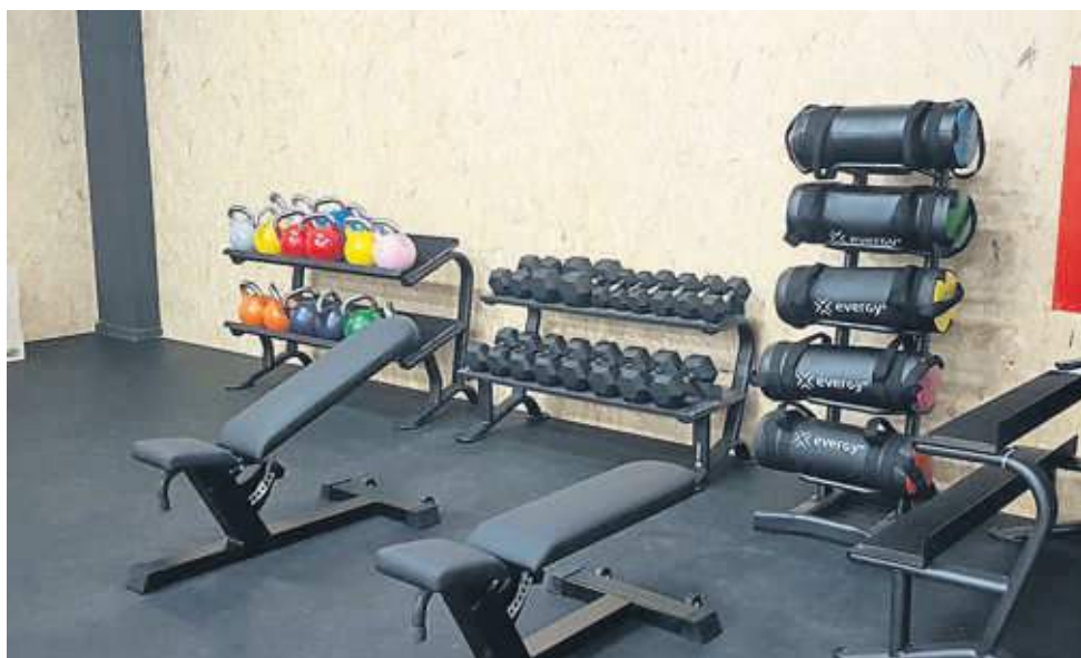
Detalle del gimnasio de la sede central de Bayer Hispania en Sant Joan Despi

La sostenibilidad es cada vez más importante en el gobierno de las empresas, y las oficinas son el lugar donde demostrarlo. Para reducir la huella de carbono, el edificio prima la madera, usa energía verde, recicla aguas pluviales o crea cubiertas vegetales. El teletrabajo, precisamente, es clave por la reducción de emisiones de los desplazamientos.