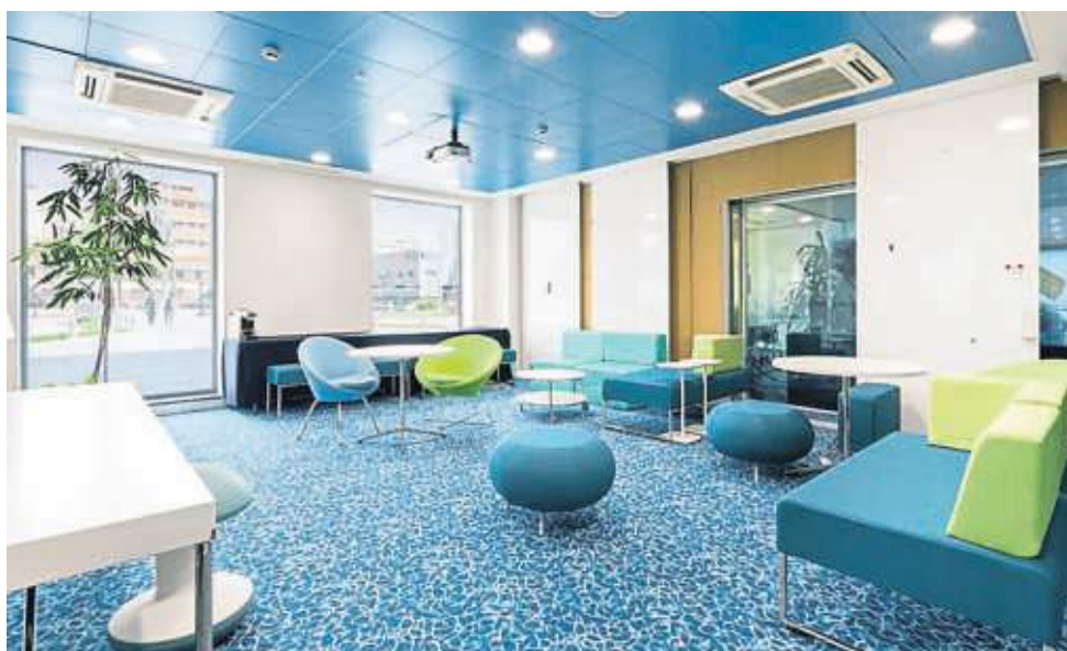
Sala de creatividad en Bayer con mobiliario flexible y muros con pizarra blanca

Equipos en los que puede haber 2 o 10 personas en la oficina, en función del día y la opción del teletrabajo, obligan a diseñar salas flexibles, con mamparas y mobiliario con ruedas. Los empleados no tendrán un sitio fijo ni estarán en el mismo lugar toda la jornada: hay zonas de colaboración y otras de concentración, para el trabajo individual.