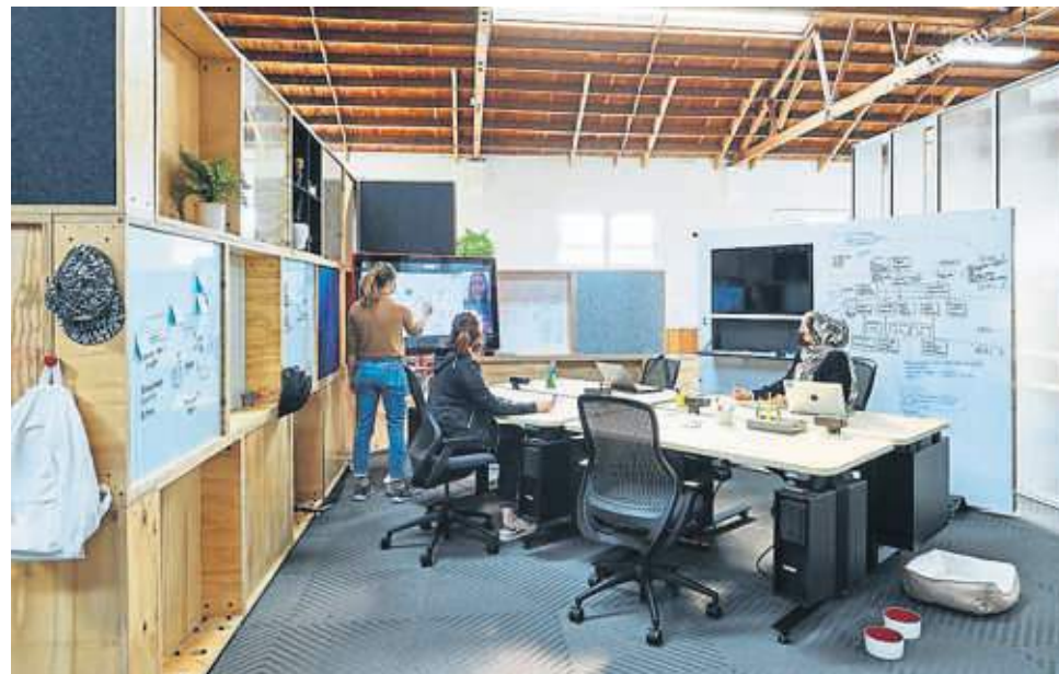
Team Pods, con muros y muebles móviles, en la sede de Google en California

Las zonas exteriores, que habían sido de ocio, se convierten en espacio de trabajo al aire libre, para frenar el contagio de la covid. Se equipan con red wifi, tomas de corriente y equipos móviles de videoconferencia. En la zona mediterránea se pueden usar todo el año, pero se han generalizado también en ciudades frías como Londres o Nueva York.