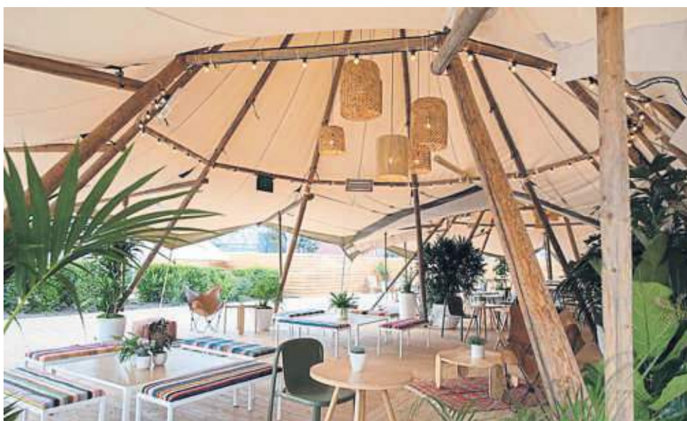
Camp Charleston, un espacio experimental de Google en Mountain View

La nueva oficina quiere ayudar a reforzar los vínculos entre personas que pasan poco tiempo juntas, la transferencia de conocimientos y la cocreación. Los despachos y las salas de reuniones pierden sentido, y se diseñan espacios para socializar, flexibles, informales, que hagan que el trabajador se sienta a gusto y parte de una comunidad.