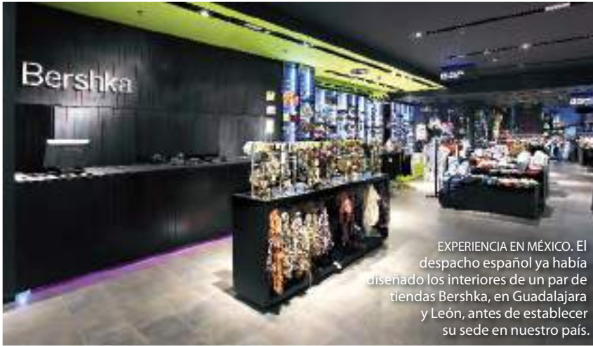
EXPERIENCIA EN MÉXICO. El despacho español ya había diseñado los interiores de un par de tiendas Bershka, en Guadalajara y León, antes de establecer su sede en nuestro país.